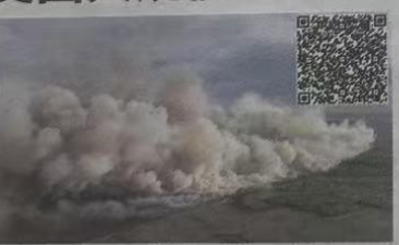
美国加州福尼亚州野火

美国加利福尼亚州野火熄灭不久,南卡罗来纳和北卡罗来纳州近日又发生大规模野火。根据美国火灾气象学监测组织统计,美国目前正有300多起野火在燃烧。 南卡罗来纳州州长亨利·麦克斯特2日宣布进入紧急状态,消防员正在与整个该州数百处野火作战。“我已宣布进入紧急状态,以进一步支持全州野