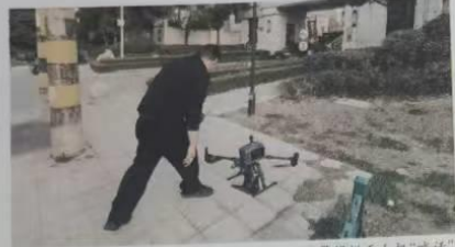
民警操纵无人机“喊话”

38600元现金,说明你已被骗,请立即至西郊派出所报案。”无人机升空后,在小区上空盘旋并重复播放着设定好的提示语音。